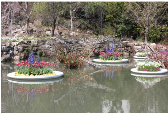
南園の50周年記念庭園。池に浮かべられた花皿鉢とクジラの親子。