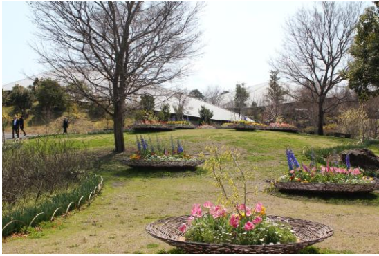
北園。建物は、地形に溶け込んで目立たないようにデザインされている。