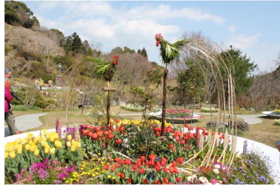
尾長鶏の花皿鉢。高知は国の特別天然記念物に指定されている尾長鶏の原産地である。