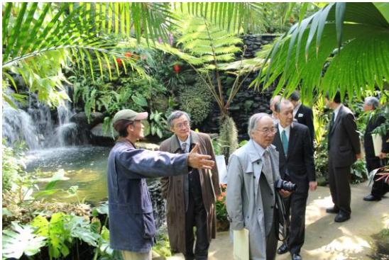
南園の温室には海外から集めた熱帯地方の貴重な植物が植えられている。