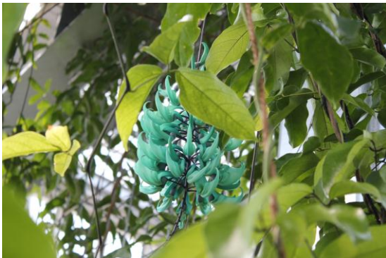
ヒスイカズラ。翡翠色をした花が咲いている。